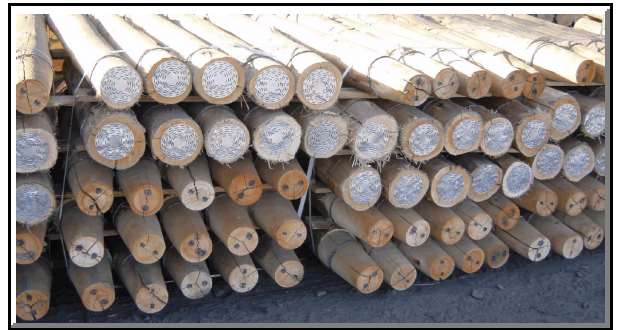
RG-135 op Masjieneerde Mynstutte